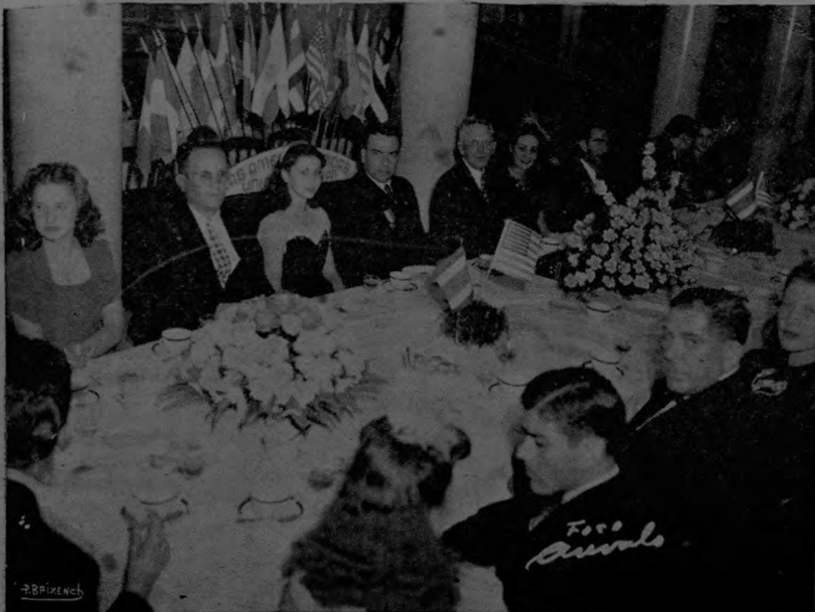
Un aspecto de la mesa que presidía el Té ofrecido por Mr. Gray, anteaayer, en la Casa España.

Agnogo que, como inesperada nota, tenemos entre nosotros a don (PASA a la página 8º)