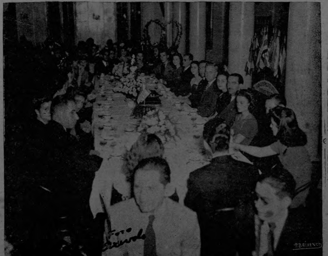
El fotógrafo Arévalo captó este otro aspecto de la brillante fiesta.