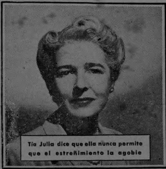
Tía Julia dice que ella nunca permite que el estreñimiento la agobie

Cómo Librarse del Estreñimiento al Llegar a los 35 Años!